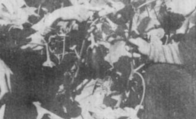
东营区蔬菜办公室积极协助牛庄镇前村引进西红柿、茄子、辣椒周年栽培越冬再生二茬新品种新技术,降低了生产成本,提高经济效益30%。

防止这种“评优”现象,笔者认为,一方面我们的企业厂家把功夫下到企业内部和市场上,拒绝参加和抵制那些以营利为目的的“评优”活动,不让某些人的想法得逞;另一方面,“评优”活动还要有严格的程序,讲究科学性,注重质量数据、企业信誉和消费者的意见,并在有关部门的监督之下进行。此外,我们的政府部门应当制定相应的政策法规,加强对评优工作的监督管理和正确引导,使其规范、公正。